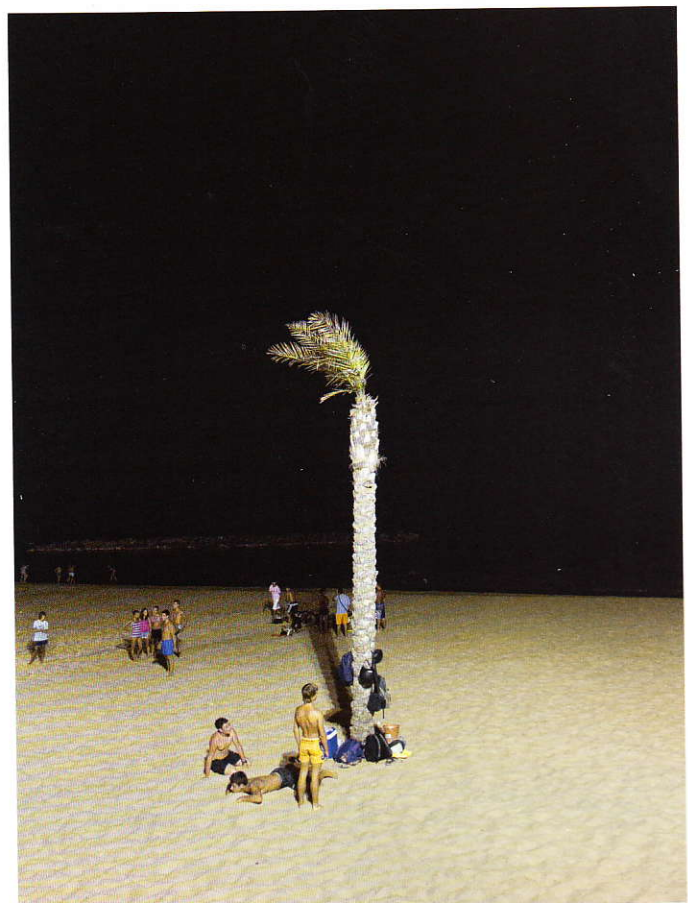
Thomas Krempke, »Das Flüstern der Dinge«, Edition Patrick Frey, 2017